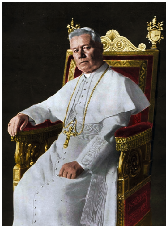
Pius X (1835-1914)

Dat deze twee pausen zich inhoudelijk bezighielden met de actieve deelname van het volk en de kwaliteit van kerkmuziek, kwam voort