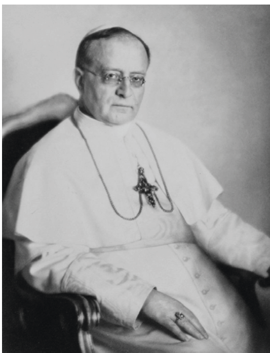
Pius XI (1857-1939)

uit hun (wetenschappelijke) belangstelling voor bijbel, liturgie én omdat ze beiden koordirigent waren geweest vóór hun verkiezing tot paus. Pius X was degene die een stimulans is geweest voor de Liturgische Beweging en Pius XI als degene die aan het streven van deze beweging een gefundeerde basis heeft gegeven, namelijk de bevordering van een bewuste, wezenlijke en